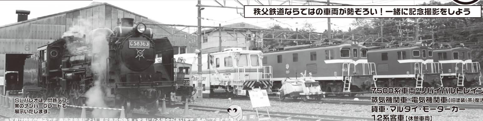
SLハレオは、開鉄75年、黒のラジエーターで展示いたします。

7500系車両・リバイバルトレイン 蒸気機関車・電気機関車(旧塗装(茶)復活) 貨車・マルチ・モーターカー 12系客車(休憩車両)