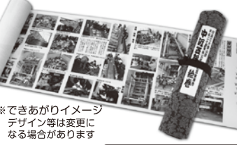
※できあがりイメージデザイン等は変更になる場合があります

※急行列車にご乗車の場合、上記乗車券のほかに急行料金(大人200円小児100円)が別途必要となります。当日ご乗車になる駅窓口でお買い求めください。