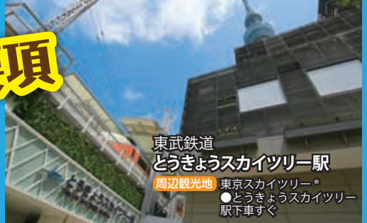
東武鉄道 とうきょうスカイツリー駅 周辺観光地 東京スカイツリー ●とうきょうスカイツリー駅下車すぐ