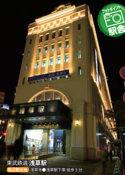
東武鉄道 浅草駅 周辺観光地 浅草寺 ●浅草駅下車 徒歩 5分