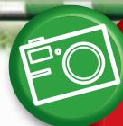
写真 大募集 駅舎・列車