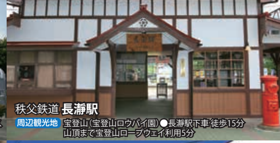
秩父鉄道 長瀬駅 周辺観光地 宝登山(宝登山ロープウェイ) ●長瀬駅下車 徒歩15分 山頂まで宝登山ロープウェイ利用5分