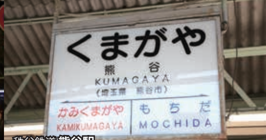
秩父鉄道 熊谷駅 周辺観光地 聖天山敬喜院 ●熊谷駅下車 バス(太田駅・西小泉駅・妻沼聖天前行き)利用「聖天前」下車