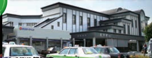
東武鉄道 館林駅 周辺観光地 群馬県立つづしが岡公園 ●館林駅下車 徒歩30分またはバス(館林、板倉線)利用「つづしが岡公園入口」下車