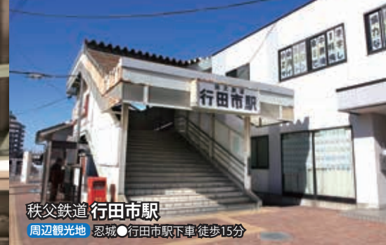
秩父鉄道 行田市駅 周辺観光地 忍城 ●行田市駅下車 徒歩15分