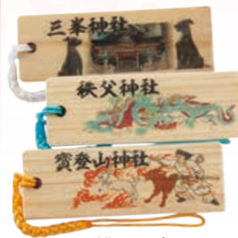
木札ストラップイメージ