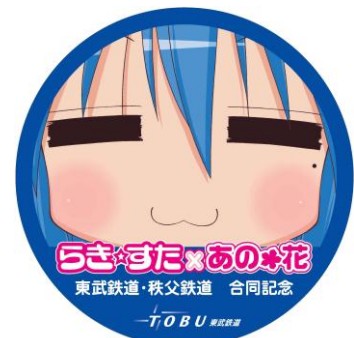
「らき☆すた」絵柄のヘッドマークイメージ