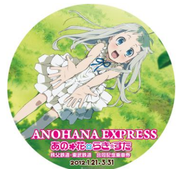
「あの花」絵柄のヘッドマークイメージ

※お問い合わせ先は、東武鉄道お客さまセンター ☎03-5962-0102 秩父鉄道営業推進課 ☎048-523-3313