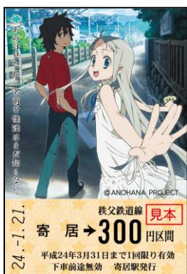
「あの花」絵柄の記念乗車券券面イメージ（秩父鉄道発売）