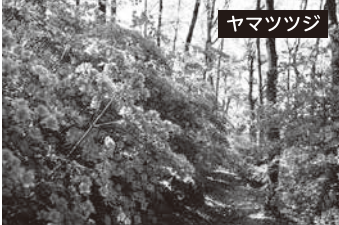
ヤマツツジ 開花時期: 5月上旬~5月中旬