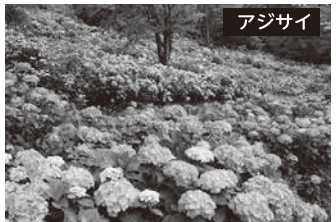
アジサイ 開花時期: 6月下旬~7月上旬