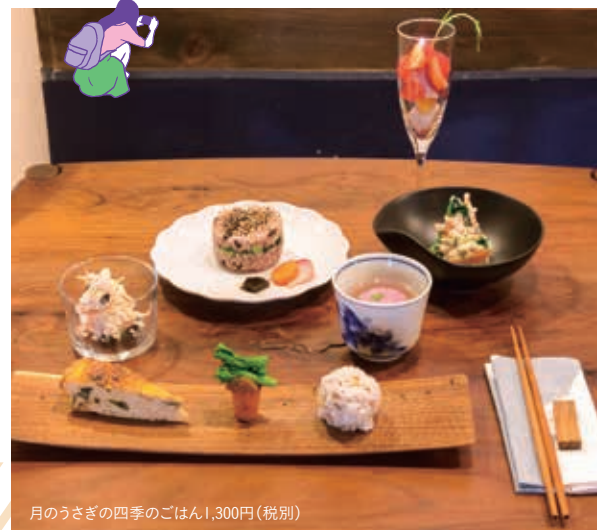
月のうさぎの四季のごはん1,300円(税別)