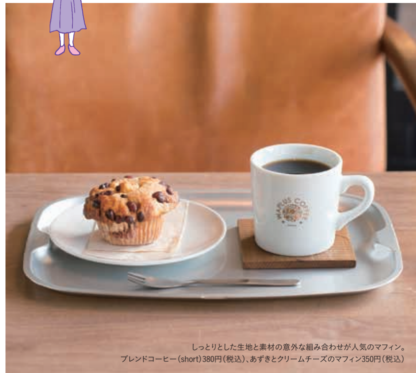
しっとりとした生地と素材の意外な組み合わせが人気のマフィン。 ブレンドコーヒー(short)380円(税込)、あずきとクリームチーズのマフィン350円(税込)