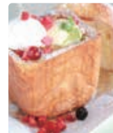
びっくりサイズのハニートースト 842円(税込)