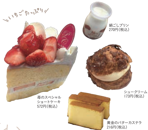
苺のスペシャル ショートケーキ 572円(税込)

サンドリオン 埼玉県熊谷市広瀬268-7 ☎048-526-4848 ①10:00～19:00 ②火曜(祝日の場合は翌日休) ③ひろせ野鳥の森駅から徒歩17分