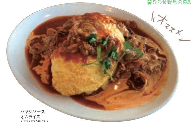
ハヤシソース オムライス 1,571円(税込)

學(マナブ) 埼玉県熊谷市広瀬651-5 ☎048-526-2717 ①10:00～22:00 (LO21:30) ②木曜日(祝日の場合は営業) ③ひろせ野鳥の森駅から徒歩8分