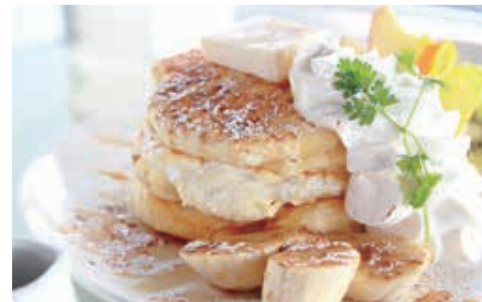
メープルシナモンパンケーキ950円(税込)

Cafe Time(カフェタイム) 埼玉県熊谷市小島822 ☎048-501-1030 ①モーニング8:00～11:00、ランチ11:00～14:30 ②軽食・デザート・ドリンクのみ14:30～17:00、ディナー17:00～22:00 ③なし ④ひろせ野鳥の森駅から徒歩20分