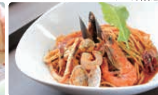
海の幸のピリ辛ベスカトーレ1,134円(税込)