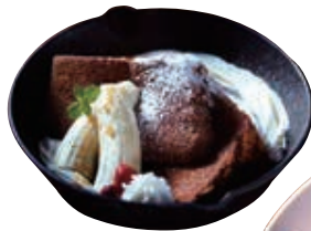
焼きシフォン 594円(税込)

LEPOSINY CAFE (レップジーニ カフェ) 埼玉県熊谷市拾六間1008 ☎048-598-5955 ①月曜～土曜 11:00～15:00、18:00～23:00 日曜 18:00～23:00 ②木曜、第3水曜 ③大麻生駅から徒歩30分