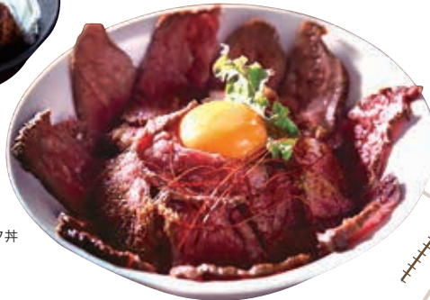
ローストビーフ丼 950円(税込)