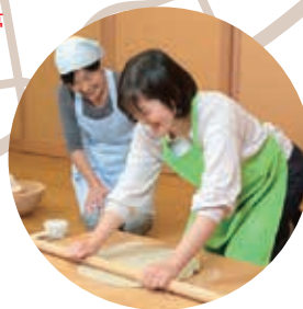
そば打ち体験は4人前1セット 4,800円(税込)で事前予約が必要

武州中川駅から徒歩すぐそば!「そばの里荒川」の味が楽しめるそば店。リーズナブルなお値段で、本格そばが楽しめる。また、食事処には「そば道場」という、そば打ち体験施設もあり、1時間半～2時間ほどで、打ったそばをその場で食べることもできる。「挽きたて」「打ちたて」「茹でたて」の「三たてそば」の美味しさを実感できる。