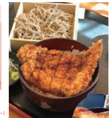
チキンカツ丼セット 870円(税込)

以前、大きな杉の日陰になり、しだれ桜の花が咲かなくなりましたが、浦山ダム工事による杉伐採後、美しい花を咲かせるようになったことから「よみがえりの一本桜」と呼ばれています。