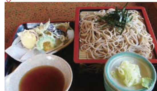
稚山女魚入り天ざるそば1,290円(税込) ※仕入れ時期により岩魚の場合があります

毎日打ちたてのそばを食べられるお店。店内は、奥秩父産出の木材を使用し、昔懐かしい情緒ある雰囲気。「稚山女魚入り天ざるそば」は、コシのあるそばとサクサクな稚山女魚入り天ぶらの相性抜群。そばの他にも、川魚料理、ソースカツ丼などご飯メニューも豊富なので、飽きることなく通える。