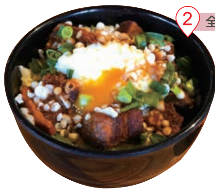
豚玉丼 中盛950円(税込) ※豚玉丼は丼+サラダ+漬物+お味噌汁がセット

秩父らしさを取り入れつつ何処にもない逸品を提供したい!そんな思いから生まれたのが、「たぬ金亭」の「豚玉丼」。豚肉は、ハーブ三元豚を使用し、秩父味噌を練り込んで、さらに特製ダレに漬け込みじっくり煮込んでいる。温泉玉子、青ネギ、「たぬ金亭」らしく揚げ玉をトッピングしており、箸のとまらないうまさだ。