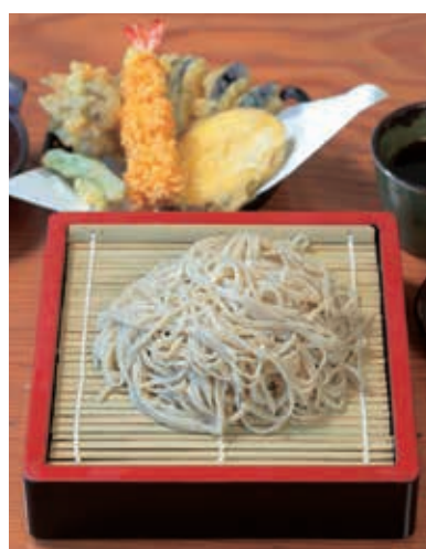
もりそば650円(税込) 天ぶら盛合せ450円(税込)

そば道場 あらかわ亭 埼玉県秩父市荒川上田野1431 ☎0494-54-1251 🕒10:00～15:00※売り切れ次第終了 🚗(12～2月)火曜、(3～11月)無休 📍武州中川駅から徒歩2分