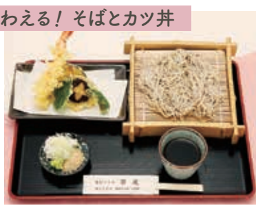
天ざるそば1,350円(税込)