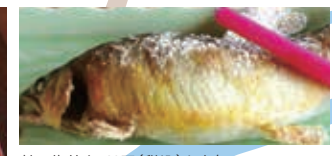
鮎の塩焼き760円(税込)も人気

太鼓亭 埼玉県秩父市荒川上田野783-1 ☎0494-54-0150 🕒11:30～14:30、17:30～19:30 🚗水曜 📍武州中川駅から徒歩8分