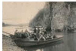
玉淀の舟遊び

埼玉県指定名勝「玉淀」。かつてここは長瀬と並ぶほどの溪谷美で知られていましたが、時代の流れにより景観は大きく変化しました。かつての「玉淀」を人との関わりを中心に紹介します。