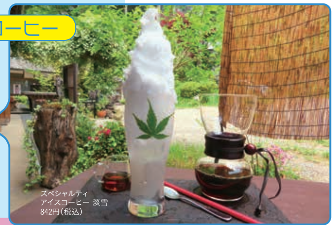
スペシャルティ アイスコーヒー 淡雪 842円(税込)

JURIN's GEO (ジュリンズ ジオ) 埼玉県秩父市上影森673-1 ☎0494-25-5511 ☎10:00~17:00(LO) Ⓜ水曜、金曜(祝日の場合営業) 浦山口駅から徒歩13分