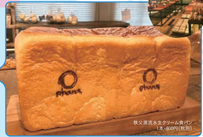
秩父源流水生クリーム食パン 1本・800円(税別)

ベーカリーズキッチンオハナ 道の駅はなぞの店 埼玉県深谷市小前田458-1 道の駅はなぞの2F ☎048-579-5087 ☎7:00~19:00 Ⓜ月曜(祝日の場合は翌日に振替) 小前田駅より徒歩15分