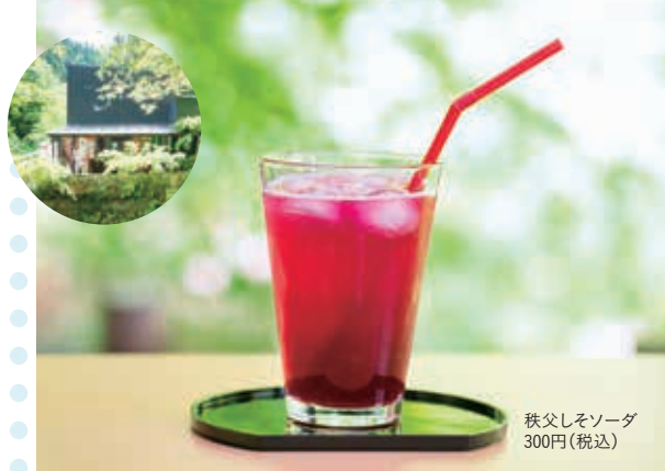
秩父しそソーダ 300円(税込)

赤いチャートの崖から約13mにわたって流れ落ちる「秩父華厳の滝」は秩父八景の1つ。清々しい気分になったら、遊歩道入り口の茶屋で休憩するのもおすすめ。手作りの麴甘酒やしそソーダなどが、疲れた体を癒してくれる。少し足をのびた先にある札所34番水潜寺には、「水くぐりの長命水」が湧き出ている、頭上から水を3杯かけると願いごとが叶うといわれる水かけ地蔵が鎮座する。