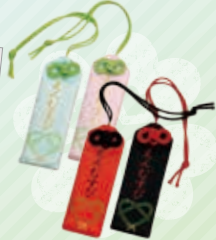
えんむすびず 各700円