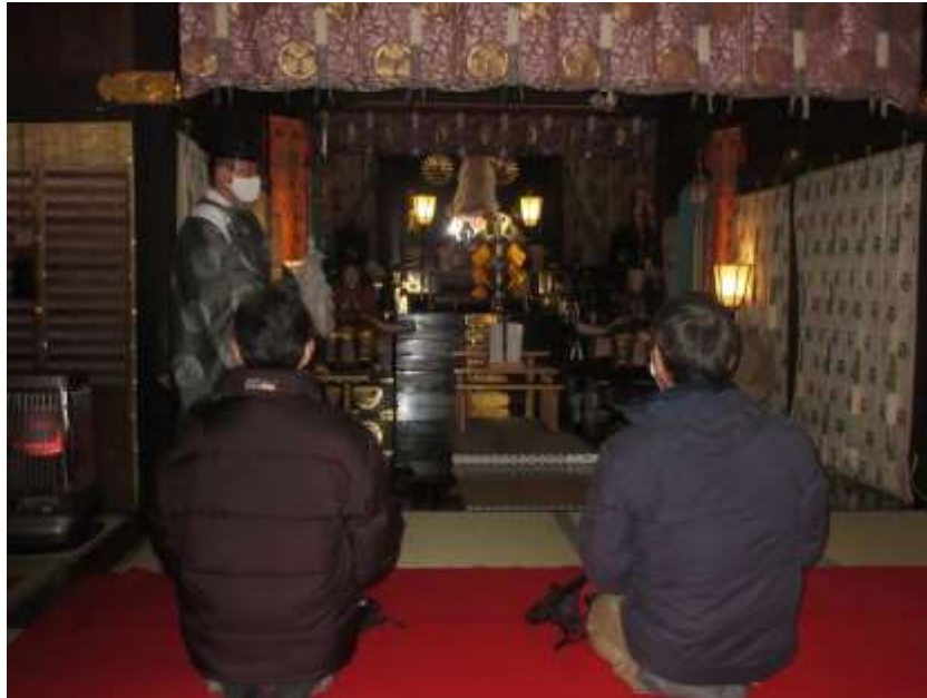
過去の秩父神社で昇殿正式参拝様子