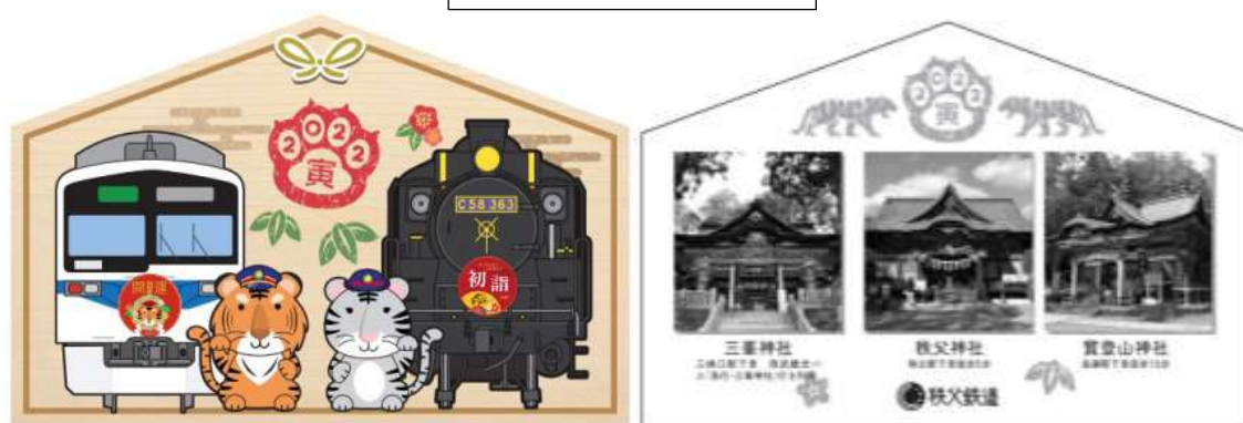
開運記念入場券台紙 イメージ

2022年干支の『寅』をモチーフにした、カラー硬券入場券です。硬券の裏面には、お願い事が書けるようになっています。また、台紙は絵馬型になっており、表面には急行開運号のイラストがデザインされ、裏面には秩父三社を紹介しています。