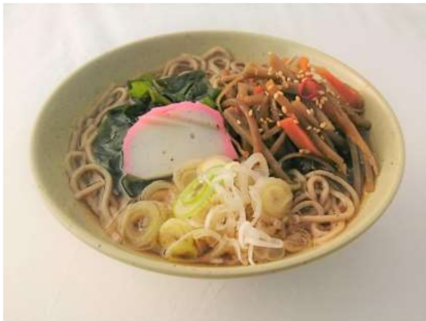
長瀨きんぴらそば イメージ

秩父鉄道グループの株式会社秩鉄商事が運営する長瀨駅すぐの「ちちてつ長瀨駅そば店」では、お正月シーズン限定メニューの「長瀨きんぴらそば」を発売いたします。かけそばに「きんぴらごぼう」をのせた温かいおそばです。そばに「きんぴらごぼう」をのせる食べ方は、秩父地域の家庭にてみられる食べ方の1つです。