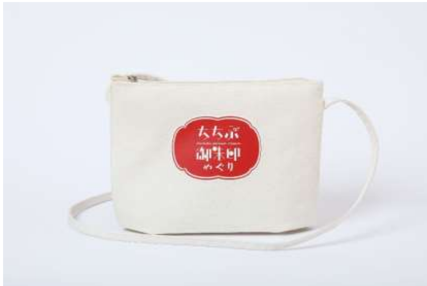
オリジナルサコッシュ イメージ

秩父鉄道では、通年で秩父鉄道沿線の寺社での御朱印めぐりをお楽しみいただけるよう、該当寺社で御朱印を受けた際に秩父鉄道のきっぷを呈示するとオリジナル木札ストラップがもらえる企画「秩父鉄道で幸せを呼ぶ列車旅 ちちぶ御朱印めぐり」を開催中の他、冬季期間限定で当ストラップを3つ集めた方に「オリジナルサコッシュ」プレゼントを実施します。