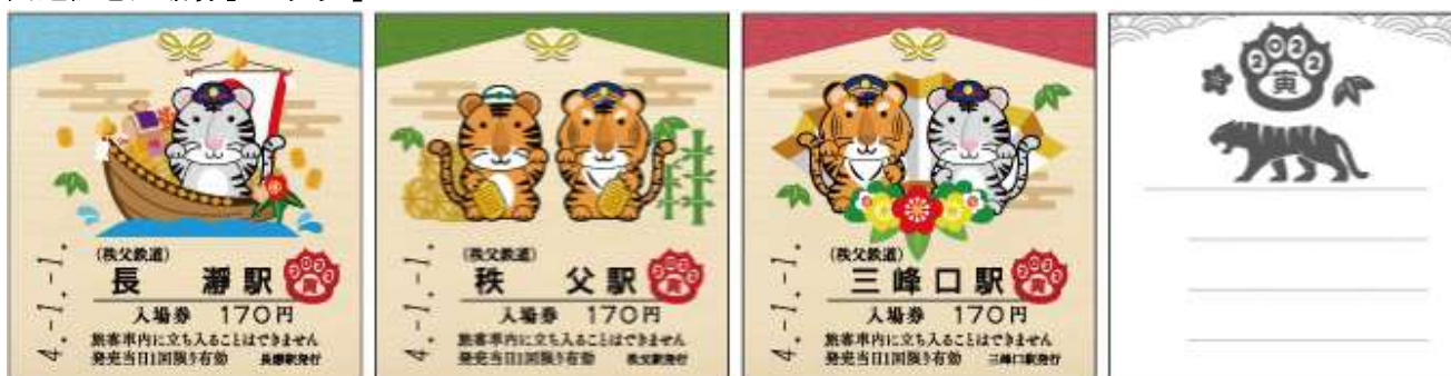
開運記念入場券 イメージ