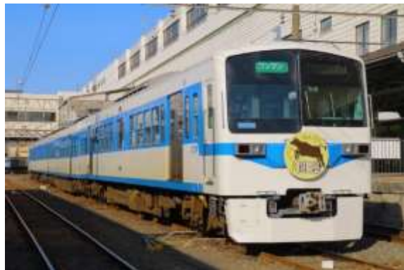
過去の急行開運号 イメージ