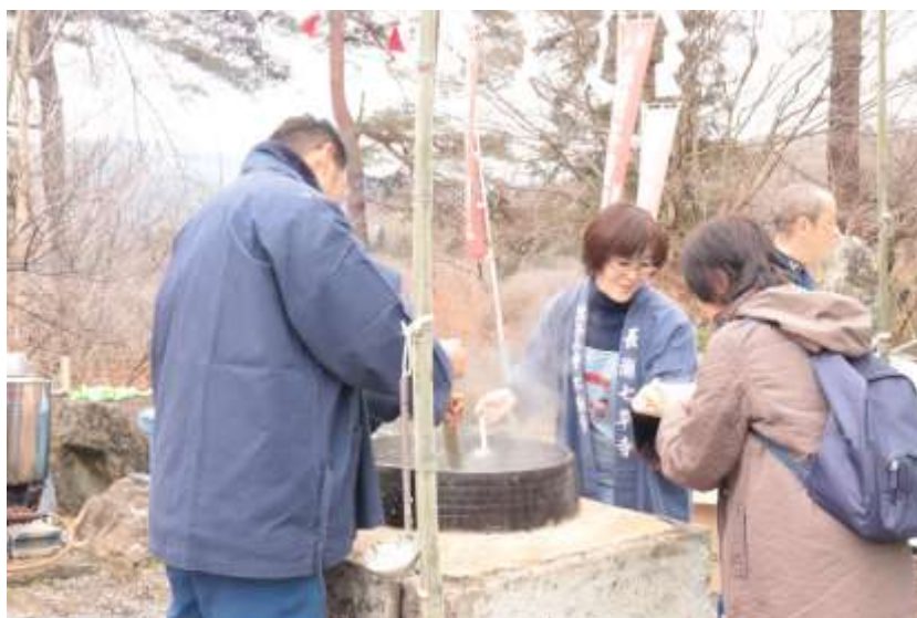
過去の七草粥まつりの様子

毎年1月7日に長瀬山不動寺では、七草粥まつりを実施します。御本尊の五大力明王の「開運粥」は無病息災を祈ったものです。大釜での七草粥振る舞いは、2年ぶりの実施となります。