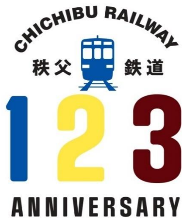
秩父鉄道創立 123 周年ロゴマーク