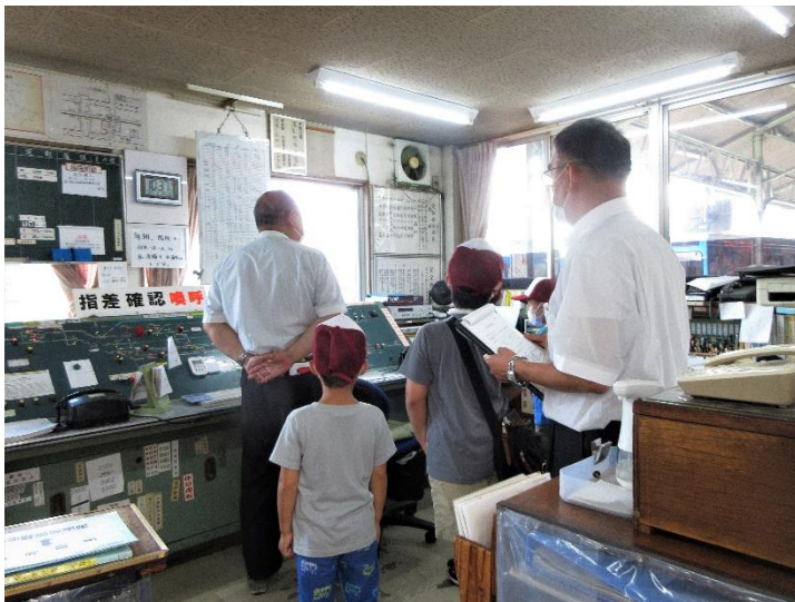
駅長の案内による鉄道施設見学 イメージ

駅長の案内による熊谷駅の鉄道施設見学、鉄道員のおしごと体験ができる約2時間のプログラムです。貴重な体験に無料でご参加いただけます。なお、参加者は抽選にて決定いたします。