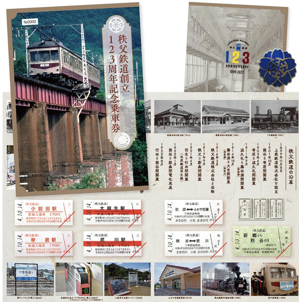
秩父鉄道創立 123 周年記念乗車券 イメージ

懐かしの硬券 7 枚と、昭和 40 年代まで当社従業員が身に着けていた社章階級バッジのレプリカをセットにした記念乗車券です。当社の 123 年の歴史を振り返ることができる特製台紙が付属します。