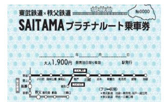
△秩父鉄道発行乗車券（イメージ）

※鉄道に関するお問い合わせ先 東武鉄道お客さまセンター TEL03-5962-0102 秩父鉄道お問い合わせ先 TEL048-580-6363