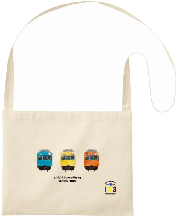
懐かしの秩父鉄道 1000 系サコッシュ イメージ

「秩父鉄道創立 123 周年記念 懐かしの秩父鉄道 1000 系サコッシュ」は、女性やお子様使いやすい斜めかけのカバンです。生成りコットン生地にて、かつて活躍していた 1000 系電車（スカイブルー、カナリアイエロー、オレンジバーミリオン）の水彩画風イラストをデザインしました。「秩父鉄道創立 123 周年記念 電車の歴史メモクリップ」は、過去に活躍した電車（1000 系、2000 系、3000 系）と現在も活躍している電車（5000 系、6000 系、7000 系）のイラストが入った円形のクリップ（6 個セット）です。