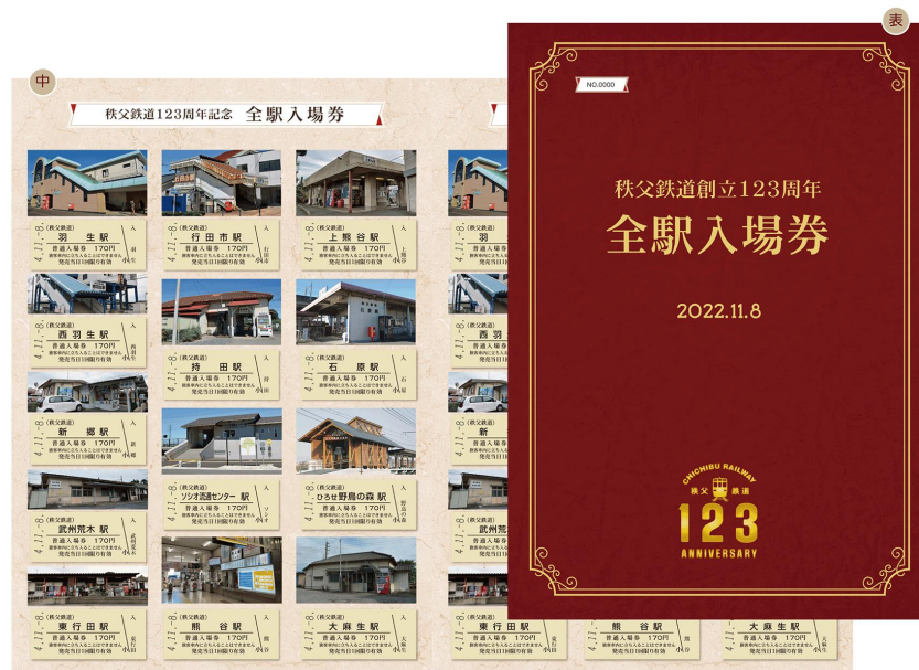
秩父鉄道創立 123 周年記念全駅入場券 イメージ