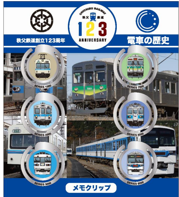
電車の歴史メモクリップ イメージ