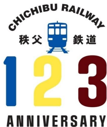
秩父鉄道創立 123 周年ロゴマーク