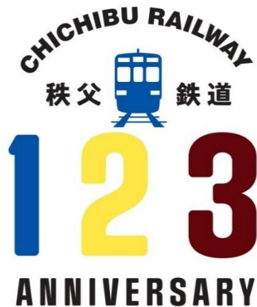
秩父鉄道創立 123 周年ロゴマーク