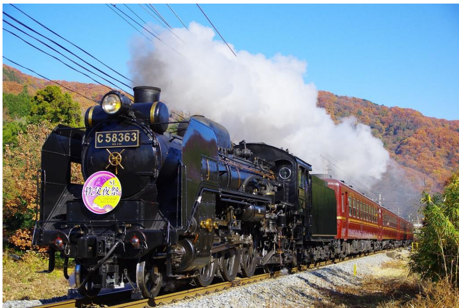
秋のSLパレオエクスプレス イメージ