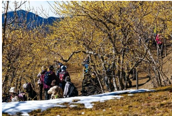
ハイキング イメージ

宝登山山頂へは宝登山ロープウェイを利用するほかに、ハイキングで行くのもおすすめです。長瀨駅から宝登山山頂へは約4km・約80分の初心者でも安心して歩けるコースです。