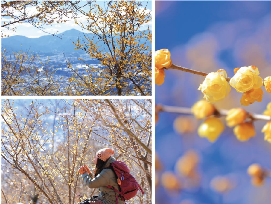
ロウバイ園 イメージ