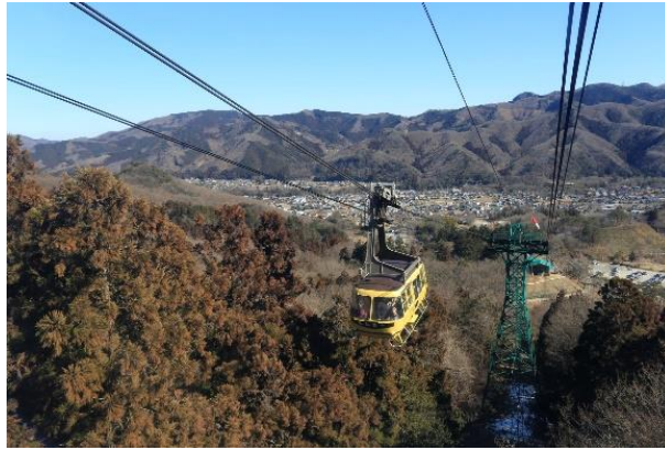
宝登山ロープウェイ イメージ