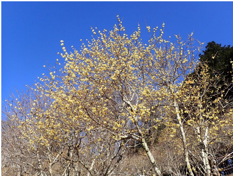
2023年1月17日(火) 現在の開花状況