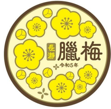
ロウバイ号ヘッドマーク イメージ