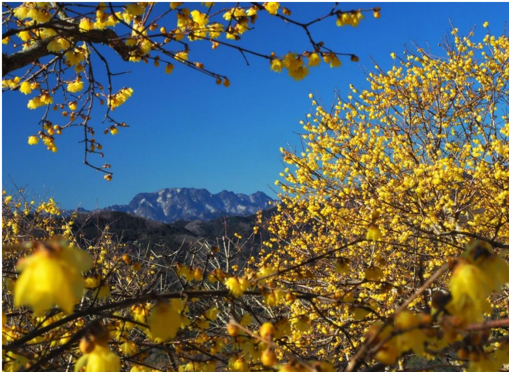
ロウバイ園からのロケーション

宝登山山頂一帯にあるロウバイ園には、3種類のロウバイ（和ロウバイ、素心ロウバイ、満月ロウバイ）が、約15,000㎡の敷地に約3,000本植栽され、晴れた日には山頂より武甲山、両神山、秩父の町並みなどが一望でき、ロウバイの濃厚な甘い香りとともに関東一のロケーションをお楽しみいただけます。詳細は、下記のとおりです。