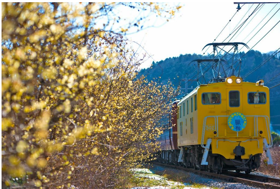
第19回秩父鉄道写真コンテスト車両部門 推薦(秩父鉄道社長賞)作品

秩父鉄道公式 Instagram アカウント https://www.instagram.com/chichibu_railway/