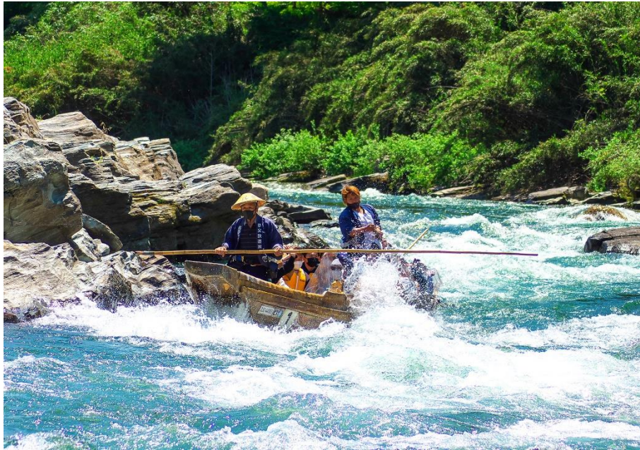
第 19 回秩父鉄道写真コンテスト長瀬ラインくんだり部門 推薦（秩父鉄道社長賞）作品