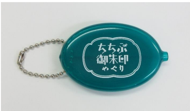
オリジナルコインケース イメージ

オリジナル木札ストラップのリニューアルを記念し、過去に好評をいただいた季節限定グッズのプレゼント企画を実施いたします。新木札ストラップを6つコンプリートした方へ、ちちぶ御朱印めぐりデザインの「オリジナルコインケース」または「オリジナル御朱印帳バンド」を特別にプレゼントいたします。当グッズはコロナ禍の2021、2022年の夏季限定プレゼントであったため、お出かけしやすくなった2023年に再度手に取っていただける機会を設けることといたしました。