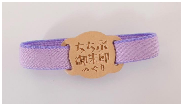
オリジナル御朱印帳バンド イメージ