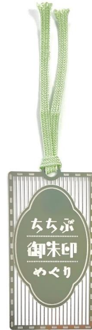
オリジナルステンレス製しおり イメージ

https://www.chichibu-railway.co.jp/station/