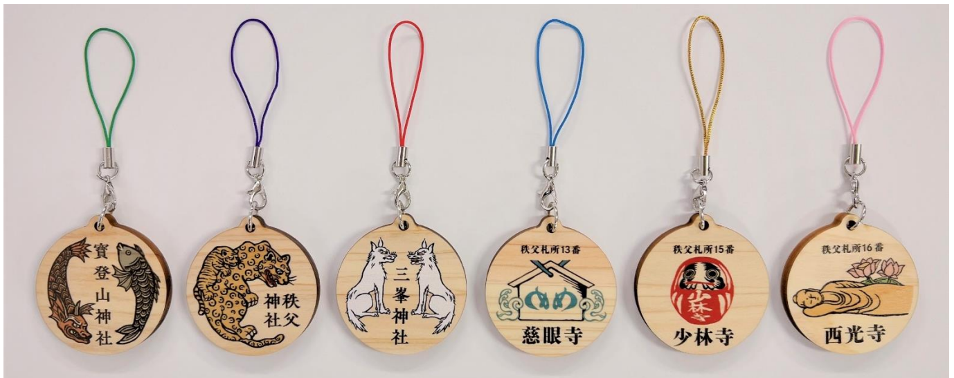
リニューアル後 オリジナル木札ストラップ イメージ

指定箇所での御朱印をお願いする際に当社線の乗車券類（デジタル版含む）を提示すると、通年にて、埼玉県産桜を使用した「オリジナル木札ストラップ」を差し上げております。