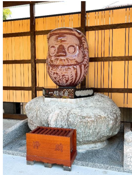
秩父札所 15 番少林寺 イメージ