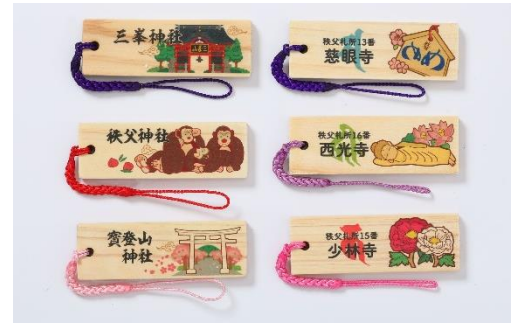
リニューアル前 オリジナル木札ストラップ (7/14まで配布) イメージ