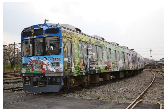
秩父三社トレインイメージ

※秩父三社トレインは神社の風景の特徴をデザイン化したもので、忠実に再現したものではありません。