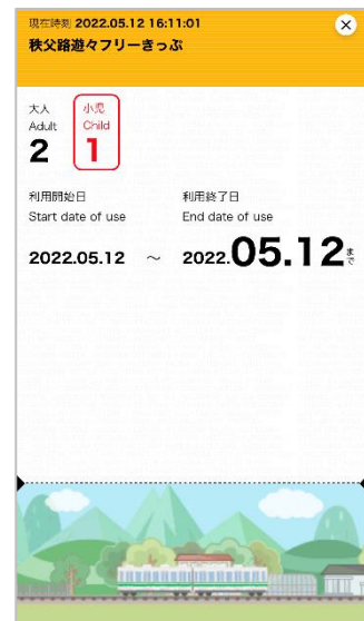
秩父路遊々フリーきっぷ デジタル版 画面 イメージ

https://www.chichibu-railway.co.jp/information/couponpass.html