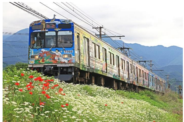
7500系車両 イメージ (フルラッピングトレイン：秩父三社トレイン)