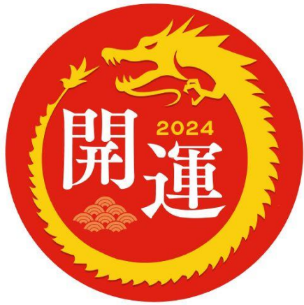
開運特別ヘッドマーク(7800系) イメージ