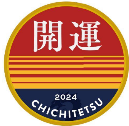
開運特別ヘッドマーク(7500系) イメージ