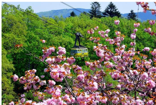
長瀬町内の桜 イメージ