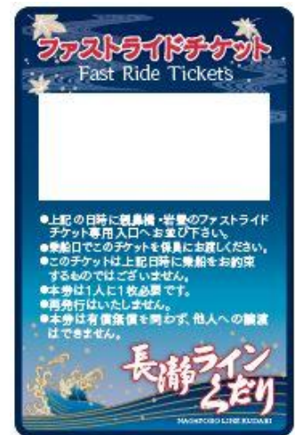
ファストライドチケット イメージ