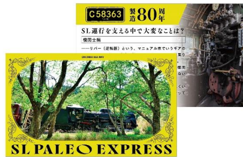
オリジナル列車カード② イメージ