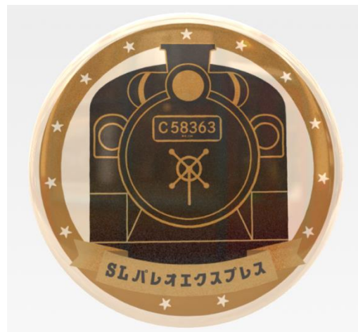
オリジナル缶バッジ イメージ