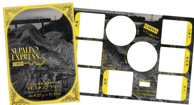
スタンプ台紙 イメージ

賞品の「SL オリジナル折り畳み傘」は、C58363の傘寿にちなんだアイテムとして選定しました。昨年実施したスタンプラリーのアンケート結果をふまえ、当ラリーではコンプリートの方全員へのプレゼントを設定します。SL に親しみを感じていただき、コンプリートの達成感も味わっていただけるよう、「SL 前面展望動画」を撮影してお届けします。