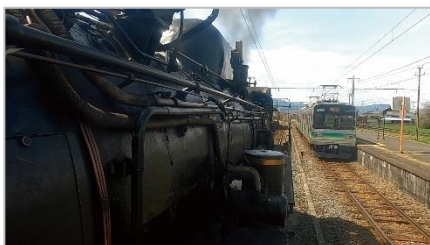
SL 前面展望動画 イメージ