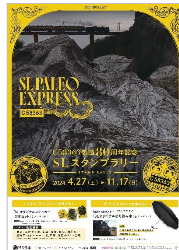
告知ポスター イメージ

https://www.chichibu-railway.co.jp/slpaleo/