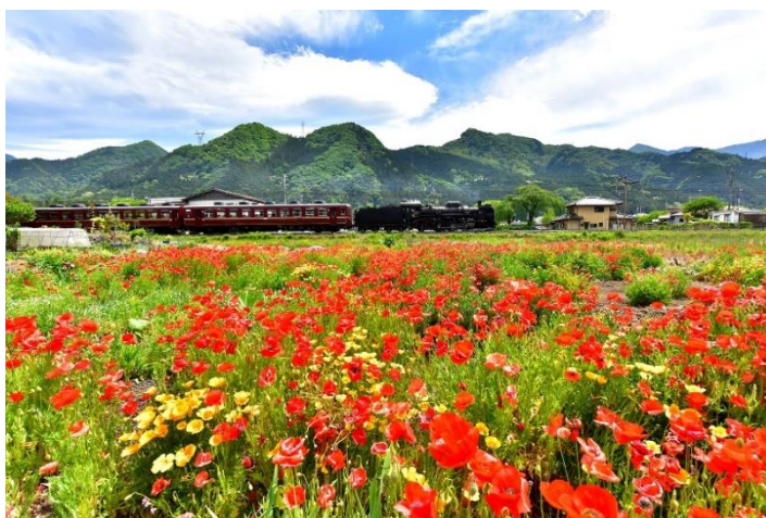
SL パレオエクスプレス イメージ