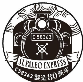
SL 車内スタンプ イメージ