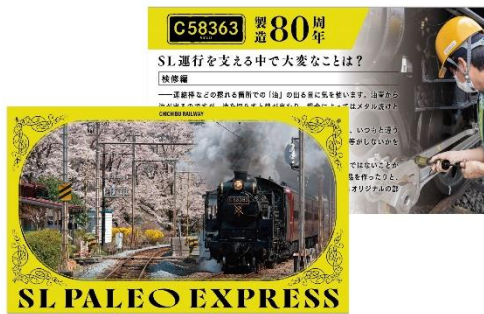
オリジナル列車カード① イメージ

ウラ 職員による「SL運行を支える中で大変なこと」(①検修編、②機関士編、③機関助手編、④車掌編)