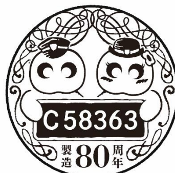
イベント会場限定スタンプ イメージ