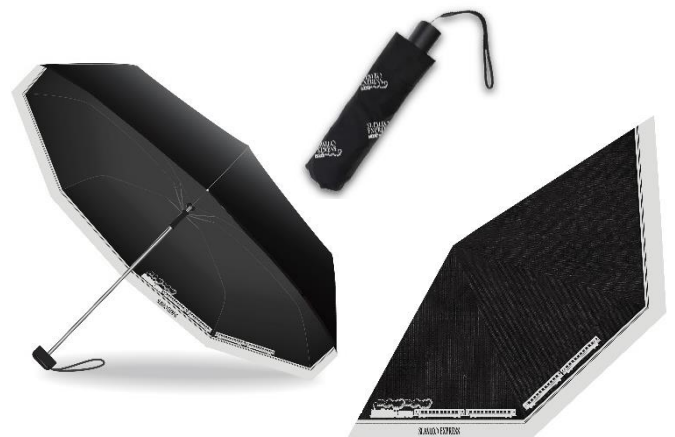
SLオリジナル折り畳み傘 イメージ