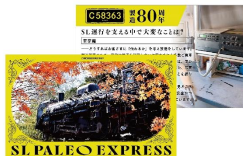
オリジナル列車カード④ イメージ

※SLのご予約方法および運転時刻の詳細などは、秩父鉄道ホームページをご覧ください。