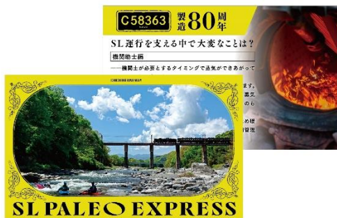
オリジナル列車カード③ イメージ