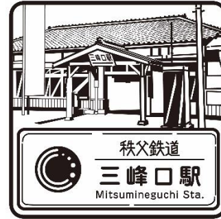
SL 停車駅スタンプ (駅スタンプ) イメージ