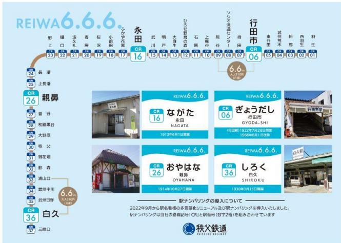
台紙裏面 イメージ