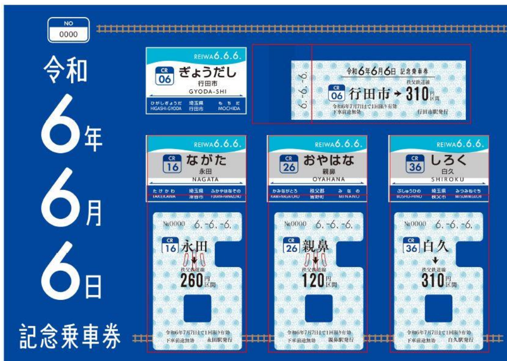
令和6年6月6日記念乗車券 イメージ

同券は、2022年9月に導入した駅ナンバリングより、CR06の行田市駅、CR16の永田駅、CR26の親鼻駅、CR36の白久駅の数字の“6”に模った特製乗車券となっています。