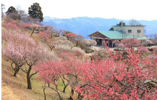
長瀬宝登山梅百花園イメージ