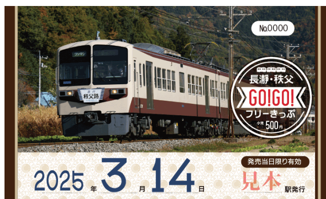
券面イメージ（表）（小児用）