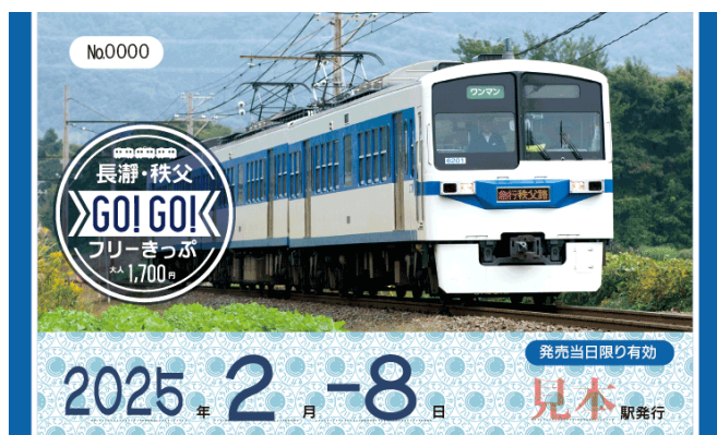
券面イメージ（表）（大人用）