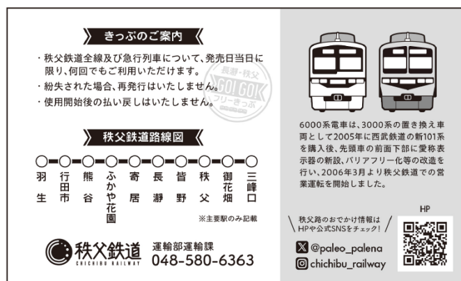
券面イメージ（裏）（大人・小児用共通）