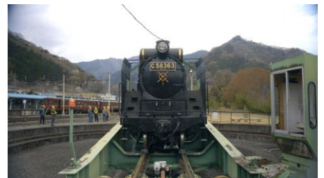
SL パレオエクスプレス イメージ動画 イメージ