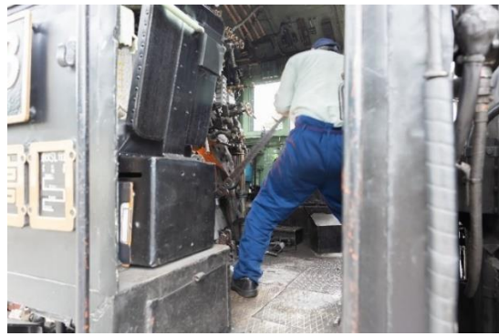
SL 転車台公園での整備作業 イメージ