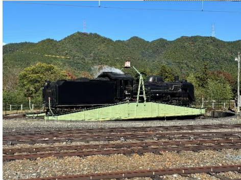
SL 転車作業 イメージ