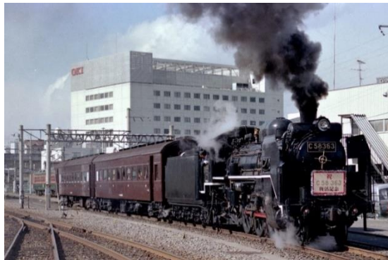
SLパレオエクスプレス復活当時 イメージ

C58363(シゴハチ サンロクサン)号機は、1944年2月19日川崎車両で製造された蒸気機関車で、現役時代は東北を中心に活躍しました。1972年に現役引退後は、吹上町立吹上小学校(現在の鴻巣市吹上小学校)の校庭で余生を送っていましたが、1988年3月開催のさいたま博覧会にあわせて「SL運行を!」の声があがり、その大役にC58363が抜擢されました。引退から約15年間を経て秩父路を走る「SLパレオエクスプレス」として復活し、秩父路観光になくてはならない蒸気機関車として活躍中です。2023年には「SLパレオエクスプレス」運行35周年を迎えたほか、2024年にはC58363号機は製造から80年を迎え「傘寿」を祝いました。