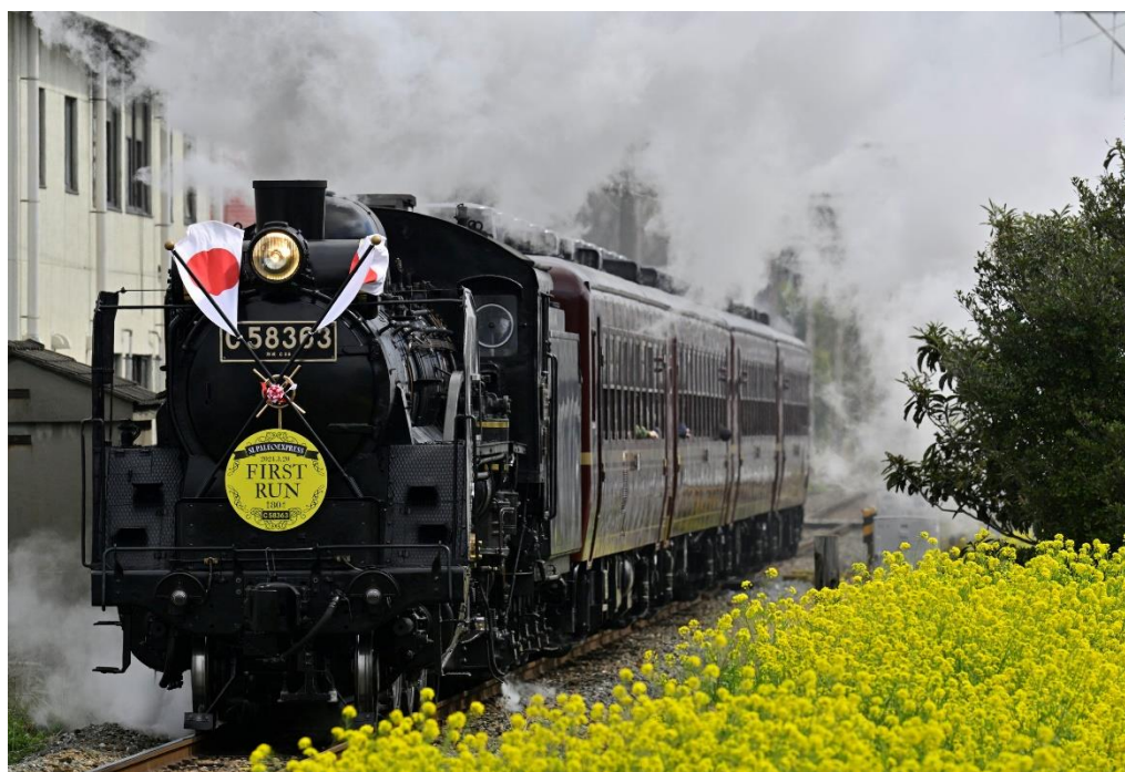
SL パレオエクスプレス イメージ