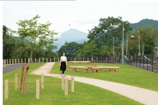
SL 転車台公園 イメージ