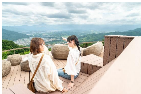
SUSABINO テラス イメージ

SUSABINO キッチンでの食事を楽しんだあとは、ぜひ同じ山頂エリアにある展望テラス「SUSABINO テラス」にも足を運んでみてください。2025年7月7日にオープン以来、多くの来訪者が散策や写真撮影を楽しむ人気のスポットで、SUSABINO キッチンとあわせて、宝登山山頂での特別なひとときを提供します。展望テラスからは、雄大な山並みや秩父・長瀬の景色を一望でき、四季折々の自然の移ろいを間近で感じることができます。特に冬季には、1月末から2月にかけてロウバイの花が見頃を迎え、甘い香りとともに早春の訪れを楽しめます。