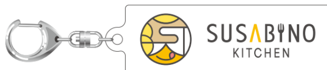
オリジナルキーホルダー イメージ