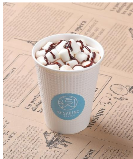
雲海ショコラ イメージ

宝登山の雄大な空をイメージした、新感覚の山頂グルメ「天空むすび」を提供します。古くから日本人に親しまれてきた「おむすび」に着目し、混ぜ合わせる具材にこだわることで、自然の恵みを多彩な食感でお楽しみいただけます。おむすびの形は、宝登山の山容をイメージしたピラミッド型を取り入れ、視覚的にも遊び心あふれる一品を目指しました。お米は埼玉県産米「彩のきずな」を使用しています。