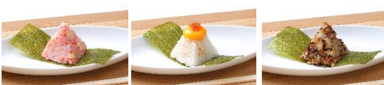
天空むすび イメージ ※左からあかね、ひなた、かすみ ※天空むすび単品での提供はありません

天空むすびは「天空むすびセット」として提供します。セット内容は、好きなおむすび2種に、お好みの小鉢、秩父名物のしゃくし菜の漬物、味噌汁が付いて、900円（税込）です。