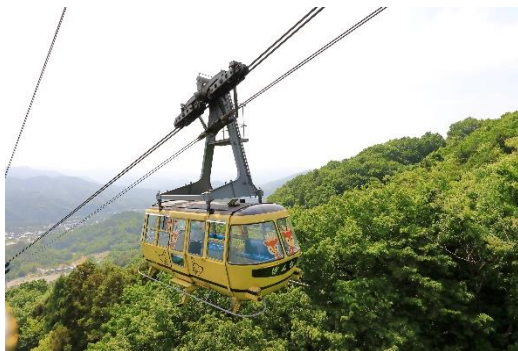
宝登山ロープウェイ イメージ