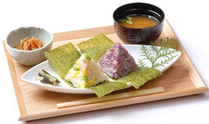
天空むすびセット イメージ