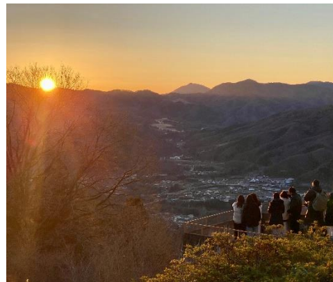
宝登山の初日の出 イメージ