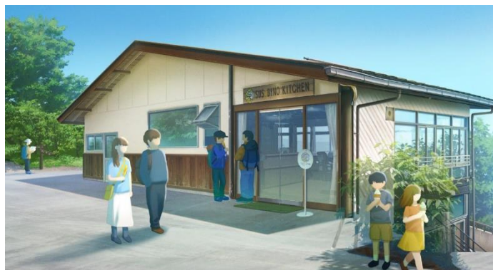
SUSABINO キッチン ビジュアルイメージ