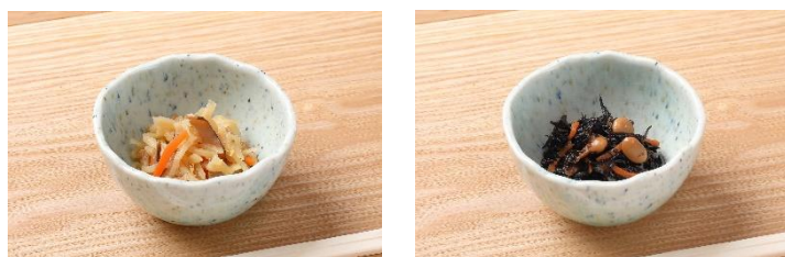
小鉢 イメージ ※左から切り干し大根、ひじき ※小鉢単品での提供はありません

ふわふわと広がる雲海をイメージしたマシュマロを添えた、見た目にも楽しめるホットドリンクです。濃厚でまろやかなカカオのコクが特徴で、山頂でのひとときをより特別なものに演出します。