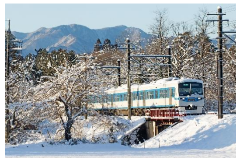
6000 系車両 イメージ

ロウバイの見頃時期に合わせて、秩父鉄道の熊谷～秩父駅間にて臨時列車「準急 HODOSAN」「各停ロウバイ号」を運行します。