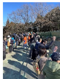
サル苑豆まき イメージ