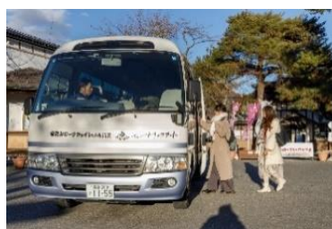
無料シャトルバス イメージ