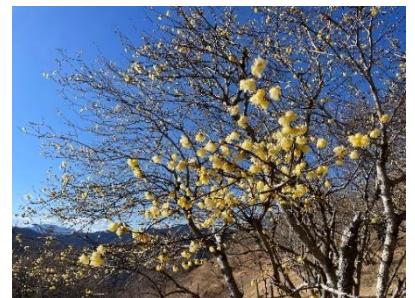
2026 年 1 月 21 日(水) 現在の開花状況