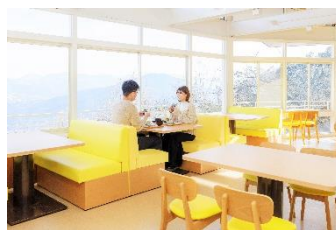
SUSABINO キッチン イメージ