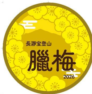
特別ヘッドマーク イメージ