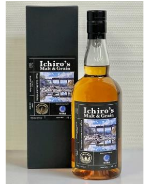
販売商品 イメージ