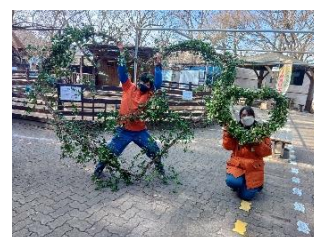
ハート型おやつ イメージ