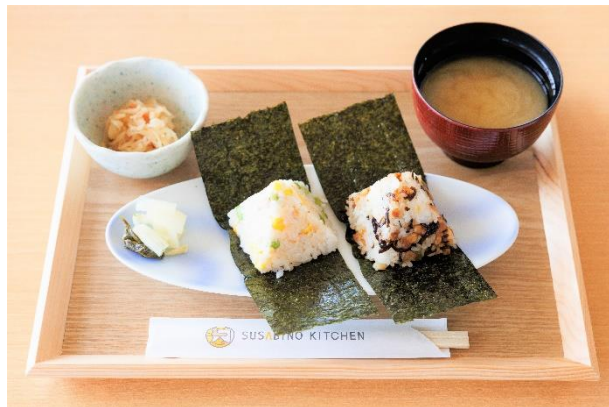
天空むすびセット （900円）イメージ