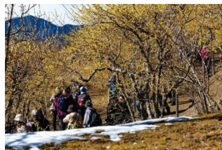
ハイキング イメージ