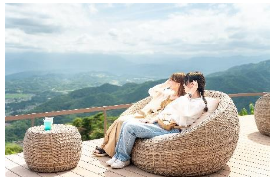
SUSABINO テラス イメージ