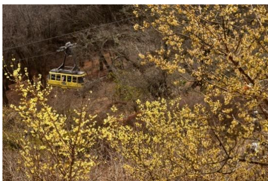
宝登山ロープウェイ イメージ

ロウバイの見頃時期に合わせて、特別に宝登山ロープウェイの始発時間を繰り上げて運行します。長瀬駅と宝登山山麓駐車場間を結ぶ無料シャトルバスにより、鉄道で気軽にアクセスいただけます。