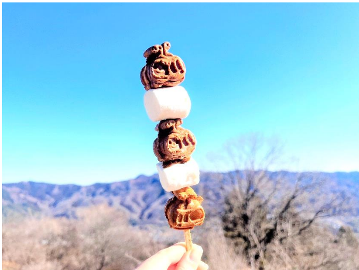
そらふわゴンドラカステラ（400円）イメージ

旧山頂レストハウスを改装した飲食店「SUSABINO キッチン」では、ロウバイの見頃に合わせて、新たな山頂グルメを提供します。空に浮かぶばんび号（ロープウェイ）をモチーフにした可愛い見た目の「そらふわゴンドラカステラ」は、冬の山頂散策をさらに楽しく彩ります（2026年1月24日（土）より販売）。そのほか、山頂の空模様を多彩な具材で表現した「天空むすび」やホットドリンクなど、雄大な景色とロウバイの香りに包まれながら堪能したいラインナップが揃います。（宝登山ロープウェイ山頂駅から徒歩1分）