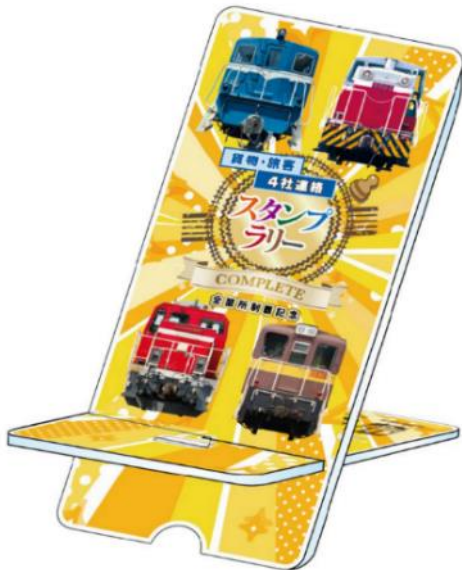
オリジナルスマホスタンド イメージ