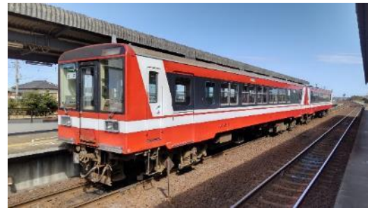
鹿島臨海鉄道 イメージ