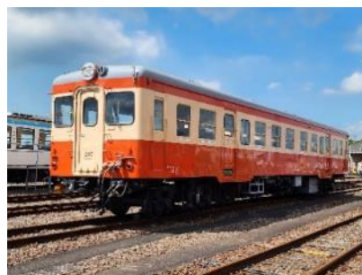
水島臨海鉄道 イメージ