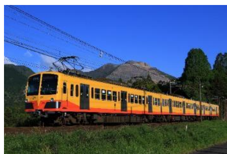
三岐鉄道 イメージ