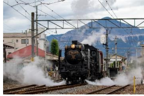
秩父鉄道 イメージ