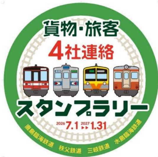
ヘッドマーク イメージ