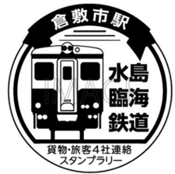
スタンプ イメージ