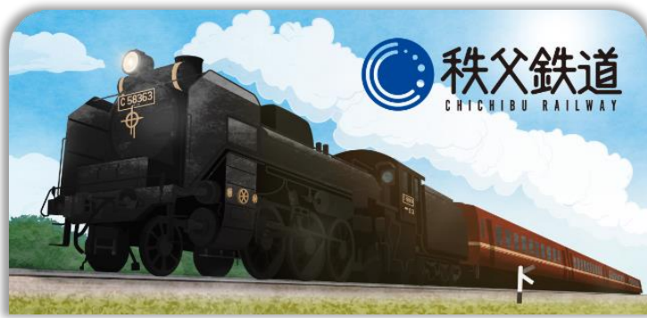
秩父鉄道のスタンプ帳ラベル イメージ