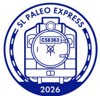
秩父鉄道のスタンプデザイン（一例） イメージ