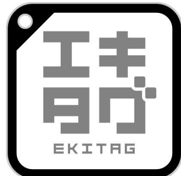
エキタグロゴ イメージ