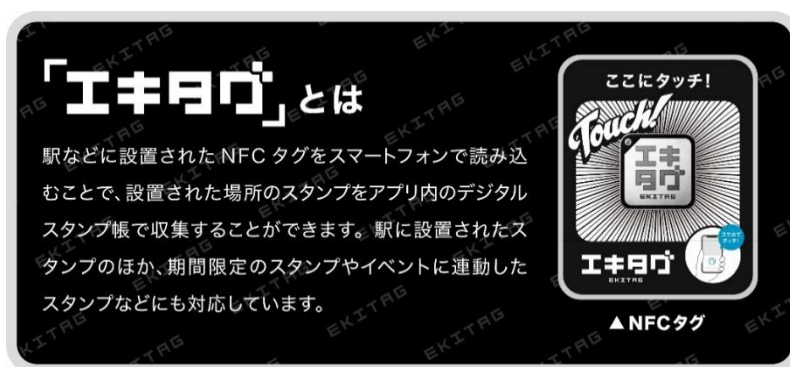
「エキタグ」とは イメージ