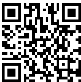
二次元コード イメージ

アプリダウンロード済の方：エキタグアプリの秩父鉄道台帳ページ（公開後）に遷移します。