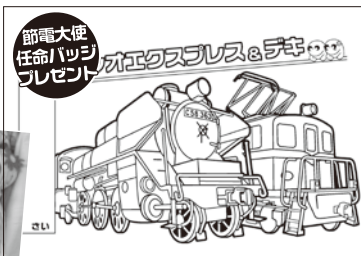
節電大使 任命バッジ プレゼント