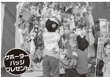
サポーター バッジ プレゼント