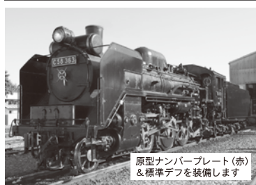
原形ナンバープレート(赤)&標準デフを装備します