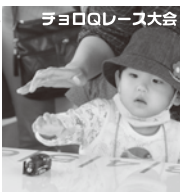
Toyoro Q-Train 大会