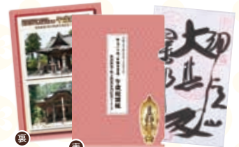
納経セット(イメージ)

ハイキングご参加の方へ、あらかじめ御朱印と筆書きをいただいた当日巡るお寺の納経とハイキングオリジナルクリアファイルのセットを受付時に販売いたします。ぜひお買い求めください。(各回250セット/なくなり次第終了)