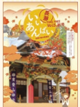
長瀬観光情報誌 「いいあんばい」 年4回(季刊)発行

毎月テーマを決めて、秩父鉄道沿線の旬な情報や秩父鉄道のイベント、ハイキングスケジュールを発信中。