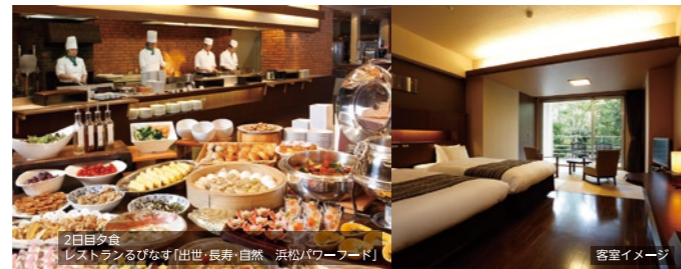
2日目夕食 レストランのびなす「出世・長寿・自然 浜松パワーフード」