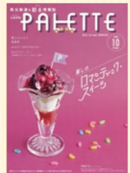
秩父鉄道を彩る情報誌 「PALETTE」 毎月25日頃発行

秩父鉄道各駅で配布しており、秩父鉄道沿線の魅力を発信中！旬の沿線スポットをチェックしよう。 ※なくなり次第終了