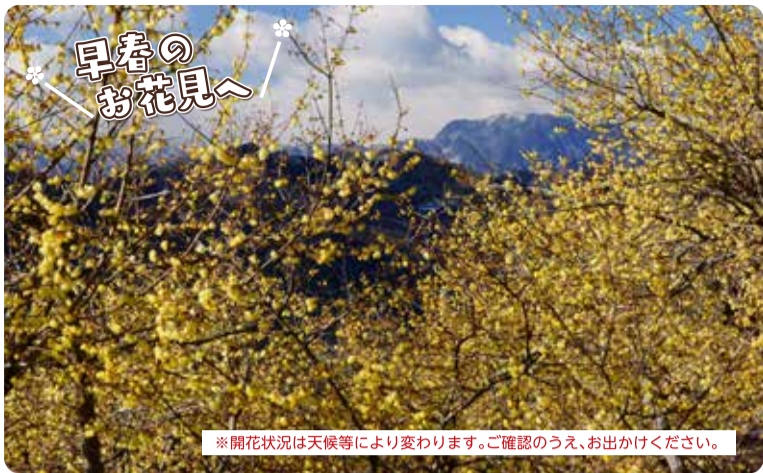
※開花状況は天候等により変わります。ご確認のうえ、お出かけください。

長瀬駅下車徒歩15分 宝登山ロープウェイ利用5分 山頂駅より徒歩2分 宝登山ロープウェイ山麓駅 0494-66-0258