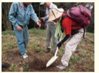
美の山公園内には、昨年10月31日(土)に実施された「桜の美の山復活ハイキング」で12種類70本の桜を植樹しました。

親鼻駅 8:30~10:30 雨天決行 自由歩行 1ポイント 約7km/約3時間【1,350kcal】 無料 ◆羽生発(7:09)→熊谷発(7:41)→寄居発(8:11)→親鼻着(8:33) ◆西武池袋発(7:05)→【直通】→親鼻着(9:14)