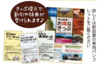
詳しくは駅設置の専用パンフレットを入手してください。