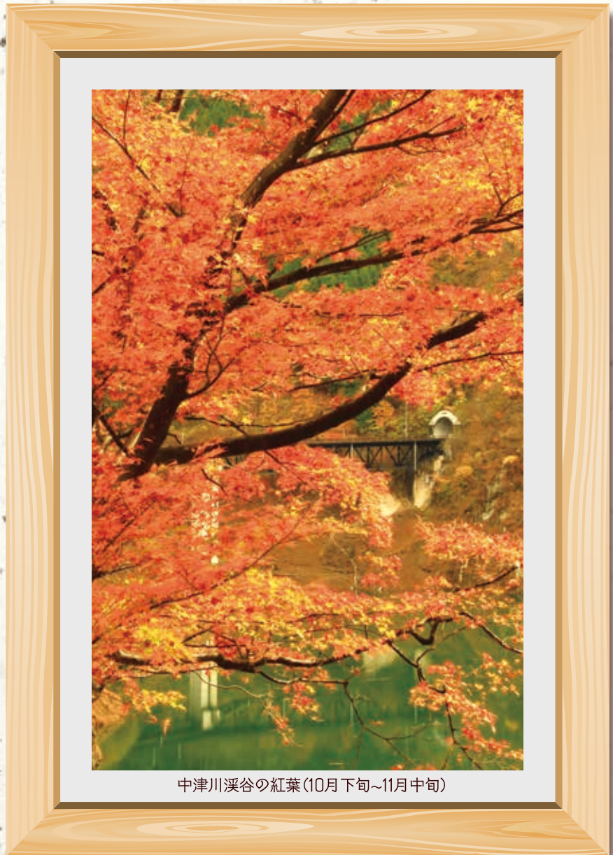
中津川溪谷の紅葉(10月下旬~11月中旬)