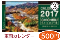
車両カレンダー 500円