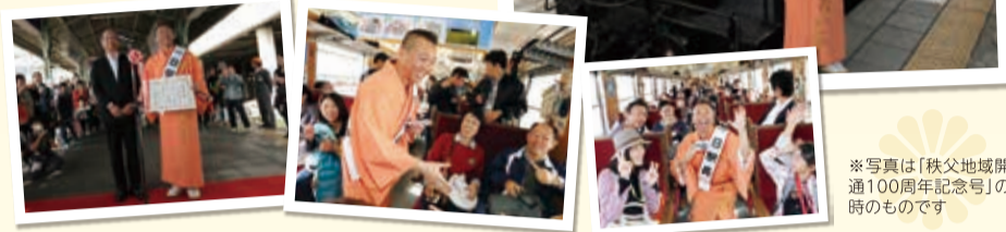
※写真は「秩父地域開通100周年記念号」の時のものです