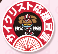
缶バッジイメージ

サイクリスト限定で三峰口駅(8:30~17:30)で秩父鉄道の「乗車券」または「入場券」提示で「わらじ井くん缶バッジ」をプレゼント中です! ※数に限りがあります