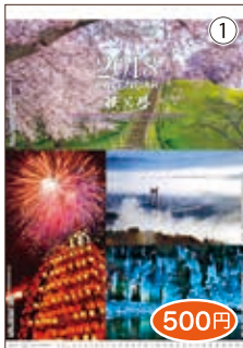
秩父路カレンダー