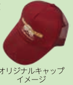
オリジナルキャップイメージ