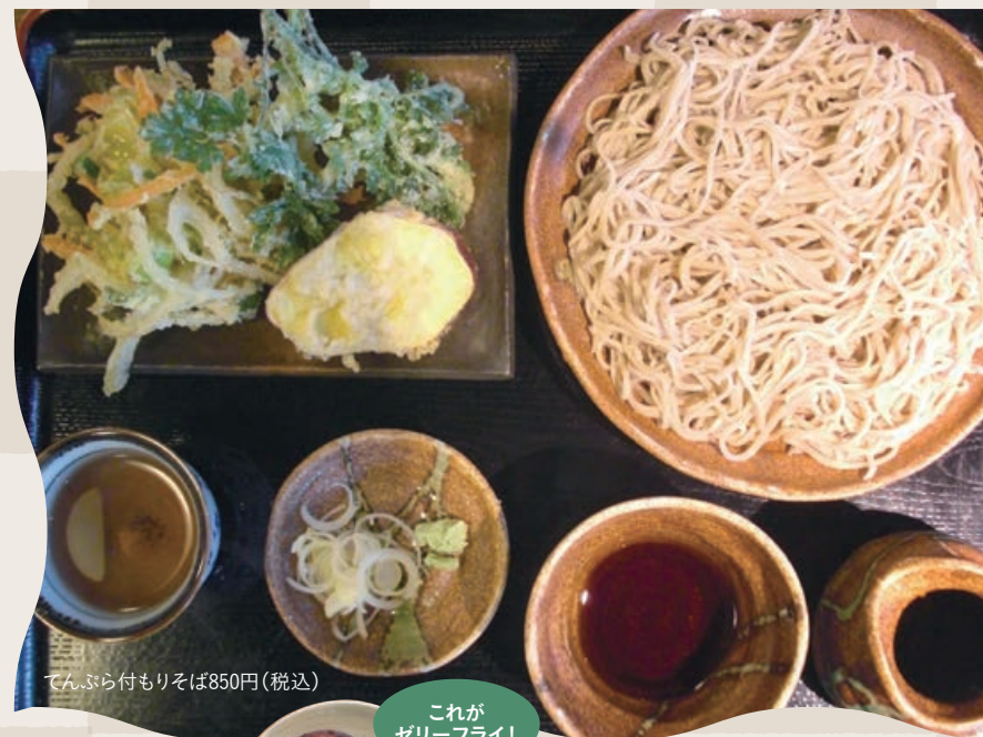
てんぷら付もりそば850円(税込)