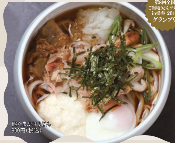
熊たまかけうどん 900円(税込)