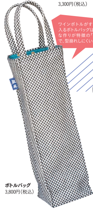
ボトルバッグ 3,800円(税込)

ワインボトルがすっぽり 入るボトルバッグは、丈夫 な作りが特徴の「刺子」 で、型崩れしにくい。