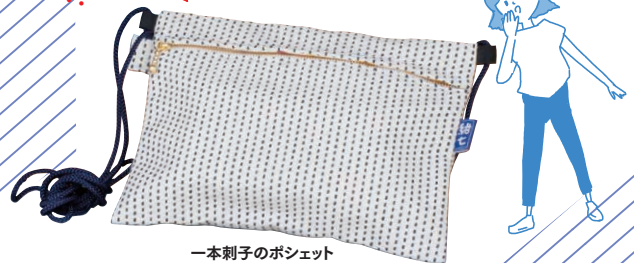
一本刺し子のポシェット 3,300円(税込)