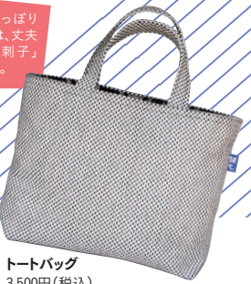
トートバッグ 3,500円(税込)

ワインボトルがすっぽり 入るボトルバッグは、丈夫 な作りが特徴の「刺子」 で、型崩れしにくい。