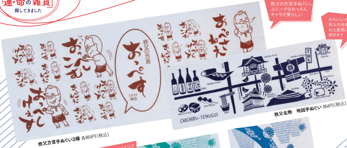
秩父方言手ぬぐい3種 各864円(税込)