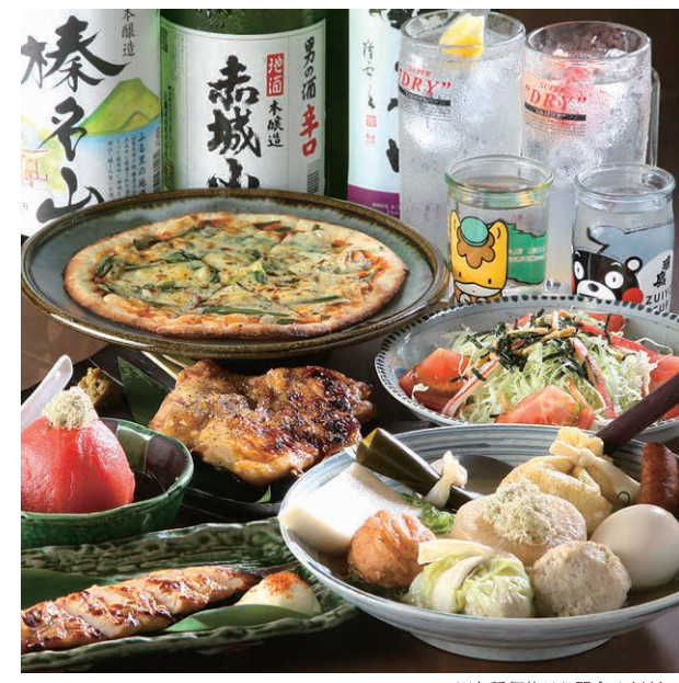
※各種価格はお問合せください

大眾酒場 ひのまるや 群馬県伊勢崎市乾町20-3 ☎0270-27-5732 🕒17:00～翌0:00(料理LO23:00)(ドリンクLO23:30) 📅日曜(月曜が祝日の場合は営業、翌日に振替) 📍伊勢崎駅北口から徒歩22分