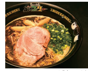
みそらあ〜めん 750円(税込)