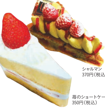
シャルマン 370円(税込)