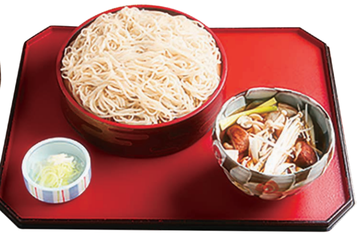
きのこ汁そば 935円(税込)