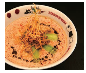
たんたんめん 800円(税込)