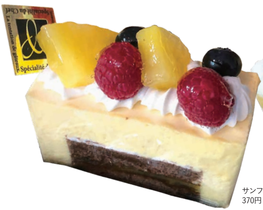
サンフォニー 370円(税込)

パティスリー ドンジョン Patisserie Le DONJON 群馬県伊勢崎市柳原町24-6 ☎0270-55-3668 🕒11:00～19:30 📅木曜 📍伊勢崎駅北口から徒歩5分