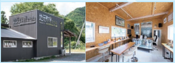
地元作家たちのitadururoroom GALLERY SHOP 写真(上)は「ガラス工房 葦路」浜口 義則氏の作品