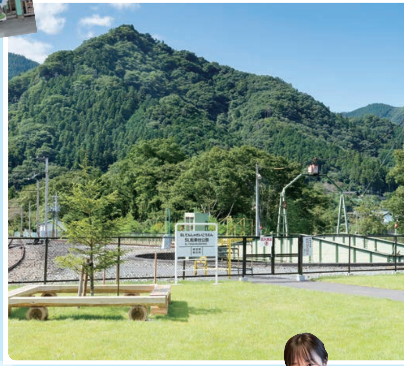
※芝生内への自転車の乗り入れ、駐輪は禁止されています