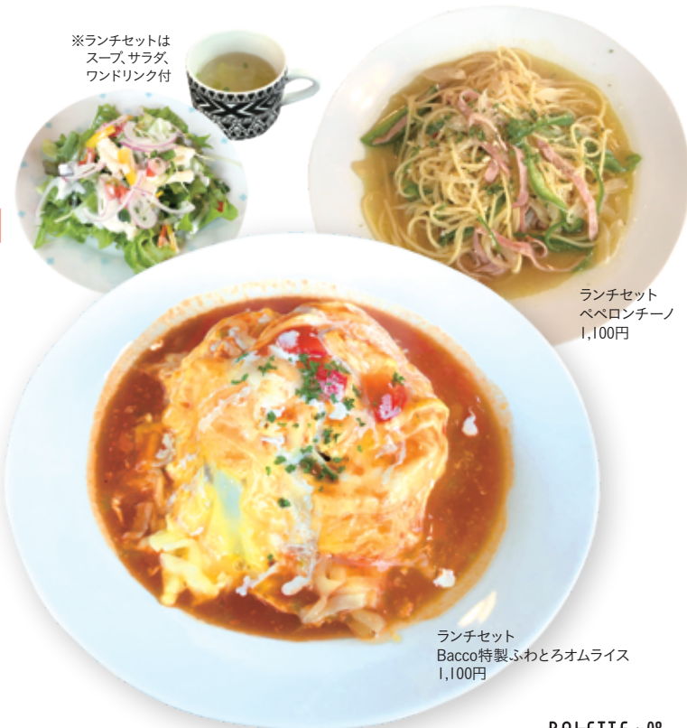
ランチセット ベベロンチーノ 1,100円