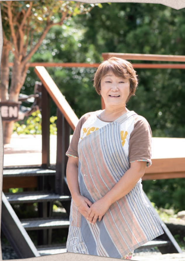
◎詳細は、7ページで紹介しています

(地元作家たちのitadururam GALLERY SHOP/いたづら工作室 オーナー)