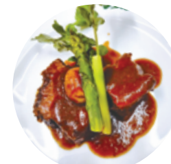
牛肉の 赤ワイン煮