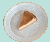
ケーキセット 800円 (ブレンドコーヒー+好きなケーキ) ※写真はバイクドチーズケーキ

店主こだわりのコーヒーが楽しめるカフェ。北欧ビンテージの食器や、木のぬくもりを感じる店内に心が安らぐ。