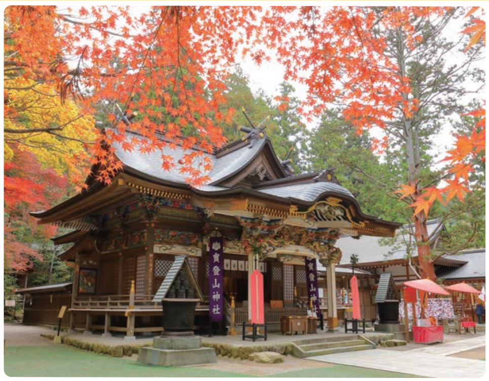
※神社の境内への自転車の乗り入れは禁止されています。駐車場脇に駐輪をお願いします

☞「サイクルトレイン」とは、自転車を電車内に持ち込んで目的地まで行けるサービスのことです。利用方法などについては7ページをご覧ください