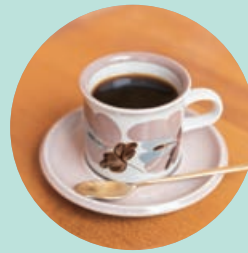
ロア・ブレンド 500円 厳選した豆を数年間熟成させた オールドビーンズを使用。飲みやすいソフトタイプ