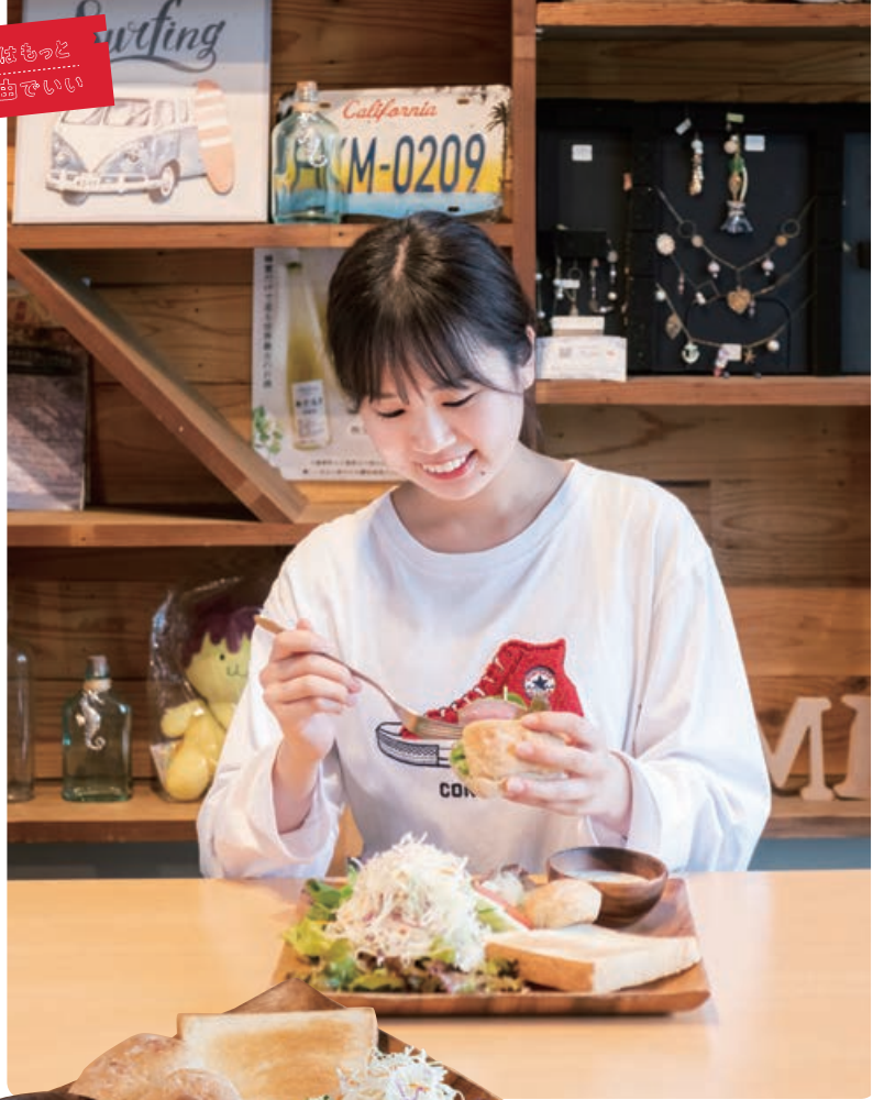
秩父野菜と横浜ビールパンのオープンサンド 750円 やわらかい牛タンとたっぷりの野菜でいただく、ヘルシーなサンド。秩父味噌のドレッシングとビール酵母で作るパンも好相性！