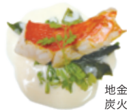
地金目鯛の 炭火焼き