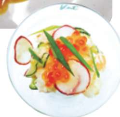
エビとキュウリの トマトゼリー仕立て