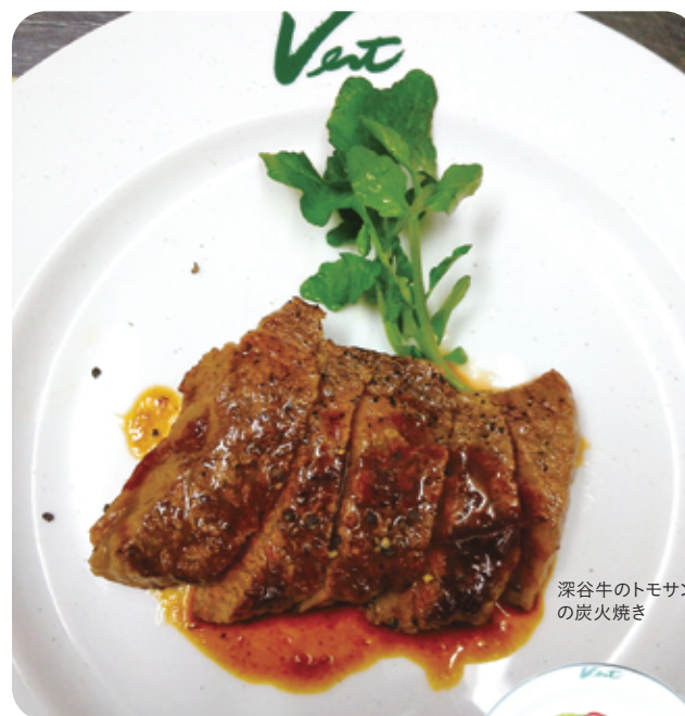
深谷牛のトモサンカク の炭火焼き