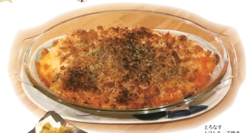
とろなす トマトチーズ焼き

よざくら 埼玉県大里郡寄居町桜沢2194-2 ☎17:00~23:00 🔥日曜 📍桜沢駅から徒歩6分