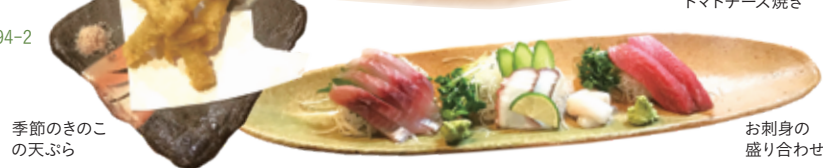
季節のきのこの 天ぷら