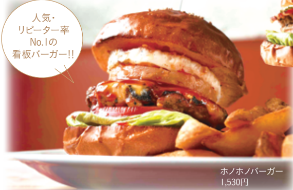
ホノホノバーガー 1,530円