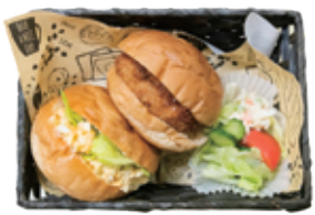
サンドイッチセット Aセット 550円