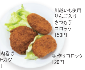
川越でも使用 りんご入り さつも芋 コロッケ 150円