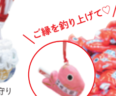
ご縁を釣り上げて♡!