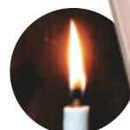
BOTANICAL color (全7色展開) 1,850円

HAZE 埼玉県川越市元町1丁目12-6 ☎070-5563-4862 🕒11:00~18:00 🌞水曜 🚶川越氷川神社から徒歩8分