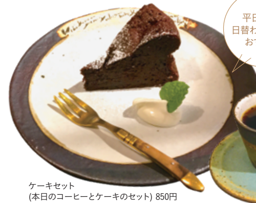
ケーキセット (本日のコーヒーとケーキのセット) 850円