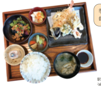
選べる18品目のデリランチセット(ドリンク付き) 1,320円