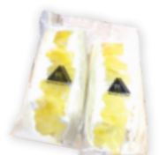
完熟バイナップル