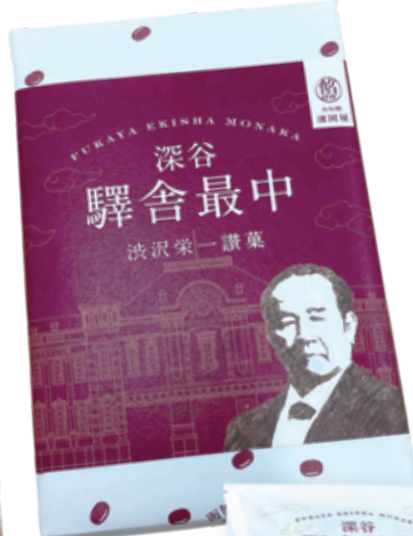
驛舎最中(三個人)680円(一個)194円

渋沢栄一翁ふるさと館OAK(シェアカフェオーク) 埼玉県深谷市西島町2-18-20 ☎048-514-2509 🕒10:00~17:00 Ⓜ木曜(シェアカフェのみ営業) 📍深谷駅北口から徒歩5分