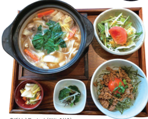
煮ぼうとう菜一セット(ドリンク付き) 1,430円