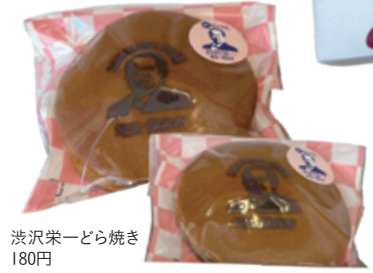
渋沢栄一どら焼き 180円