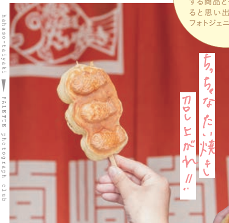
のび〜るチーズたい焼き500円

埼玉県秩父市番場町17-17 ☎0494-24-2138 🕒11:30〜19:00(売り切れ次第終了) ※変更になる場合があります 🔥火曜 🏠御花畑駅から徒歩5分