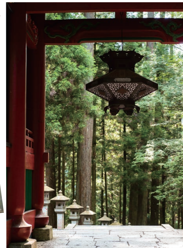
mitsumine-jinja PALETTE photograph club

霧に包まれている三峯 神社はさらに荘厳な雰 囲気ですてりあス。 ぜひ撮影してみよう。