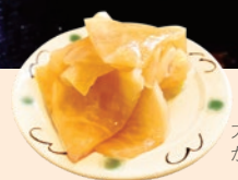
大根のかぼすポン酢漬も!