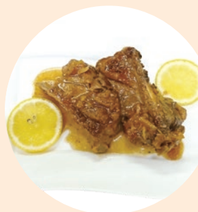
黄金スペアリブ 980円

埼玉県秩父郡小鹿野町 小鹿野814-1 ☎0494-75-2280 🕒11:00~14:00、17:00~21:00 🗓️水曜 ※祝日の場合翌日 📍小鹿野車庫バス停から徒歩4分