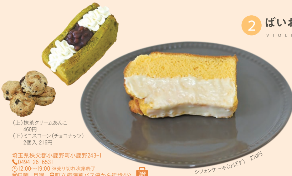
(上)抹茶クリームあんこ 460円 (下)ミニスコーン(チョコナッツ) 2個入 216円

埼玉県秩父郡小鹿野町小鹿野243-1 ☎0494-26-6531 🕒12:00~19:00 ※売り切れ次第終了 🗓️日曜、月曜 📍町立病院前バス停から徒歩4分