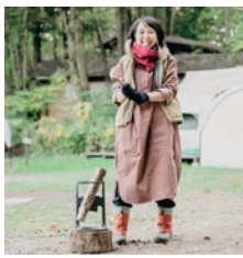
今月号の表紙: 満願ビレッジオートキャンプ場

冬の秩父の夜空にご覧になった ことありますか? 空気が澄んで星 が手に届きそうほどに美しいん です! そんな体験をしていただき たくて、今号は冬のキャンプをおす めしてみました。キャンプ場によ って用意しているものが違ったり、ロ ケーションもいろいろあるの、今 号を参考に自分に合った場所が見 つけられるといいな、と思います。