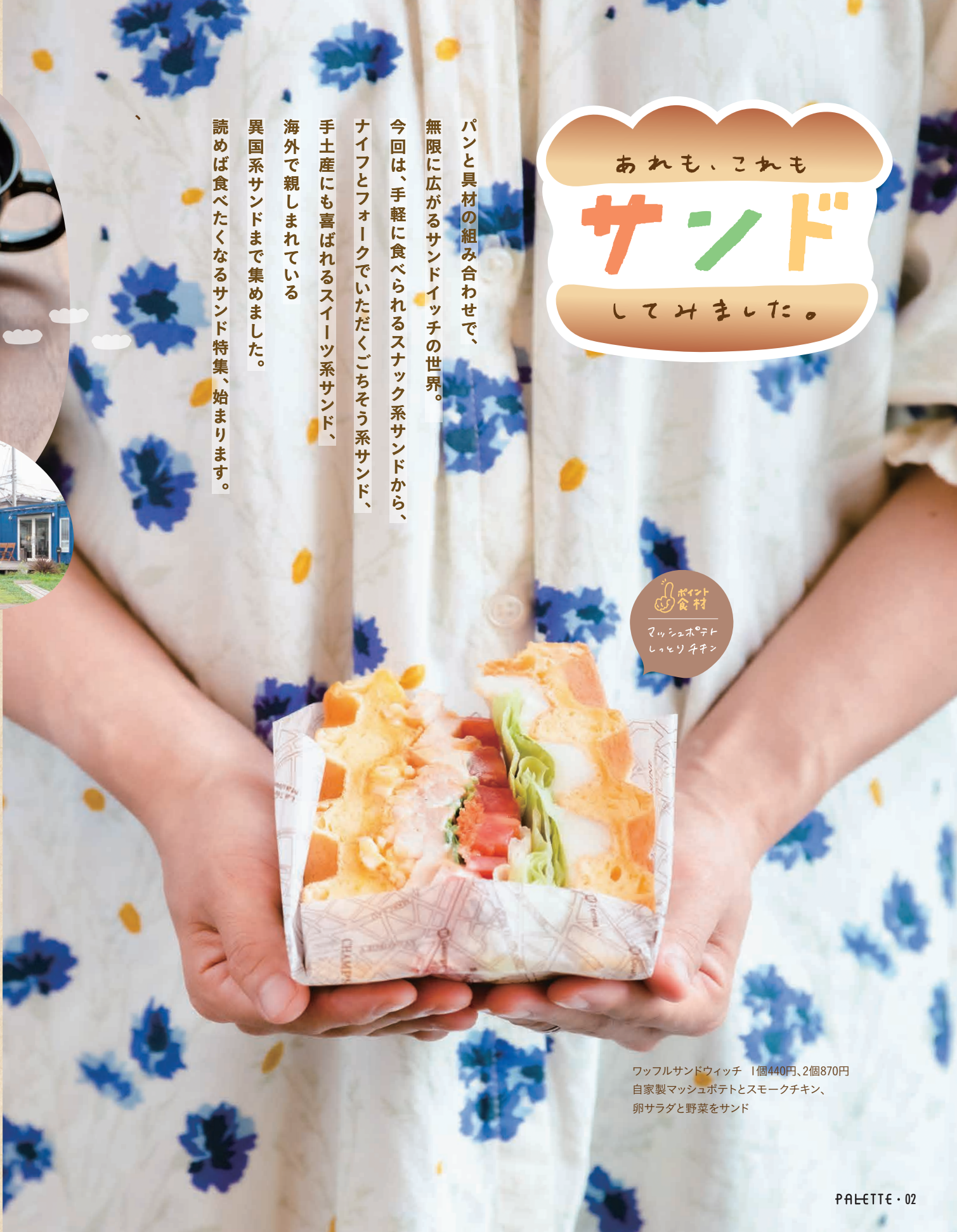
ワッフルサンドウィッチ 1個440円、2個870円 自家製マッシュポテトとスモークチキン、卵サラダと野菜をサンド