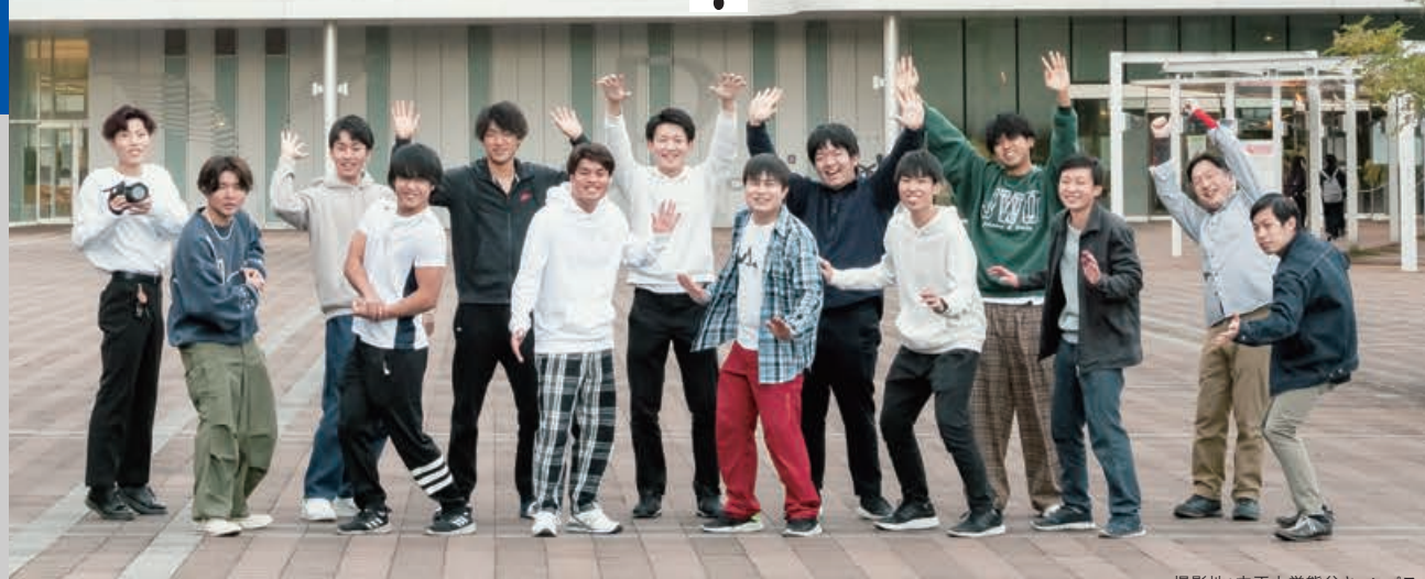
撮影地：立正大学熊谷キャンパス

新型コロナウイルス感染症拡大防止のため、各営業情報・イベント内容に変更・中止がある場合があります この「別冊PALETTE」の印刷費の一部に立正大学地理学科地域連携事業支援費を用いています